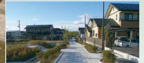
写真5 集会所、広場整備(小川町地区)