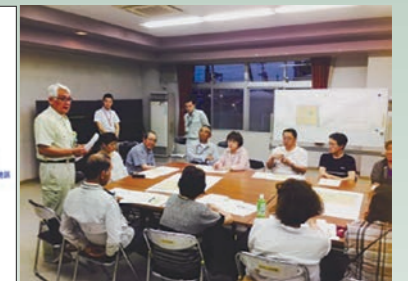
写真2 ワークショップ

災集団移転促進事業支援業務」を実施し、派遣職員を含む南相馬市担当部署26名と当社事務所職員20名の協働体制で、事業を推進していくことになった。事業の内容は、①事業マネジメント、②事業計画支援、③設計・施工管理支援、④用地交渉支援である。