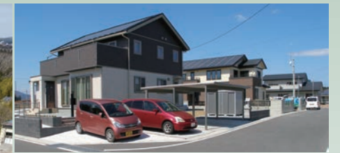
写真4 完成入居済地区(上高平地区)