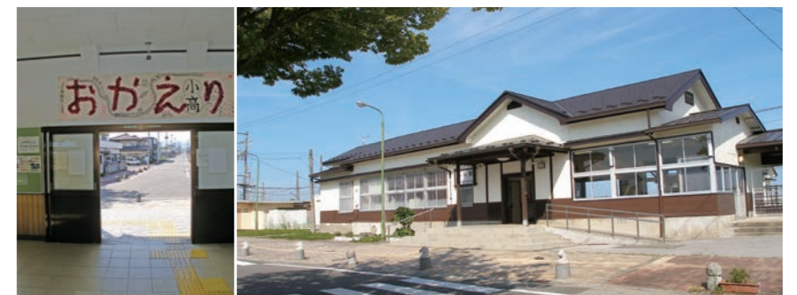
写真6 再開した小高駅

今後は安心して居住や生活することを可能とする社会環境づくり、生活環境づくりのためのソフト施策の展開が急務である。