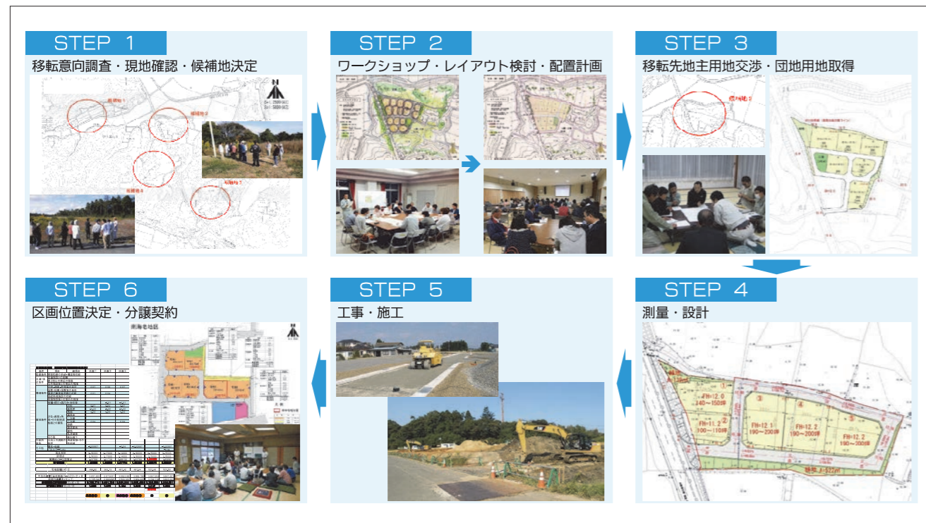
図5 防災集団移転促進事業のステップ