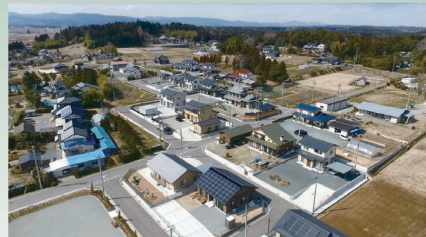
写真3 完成入居済地区(北海道地区)